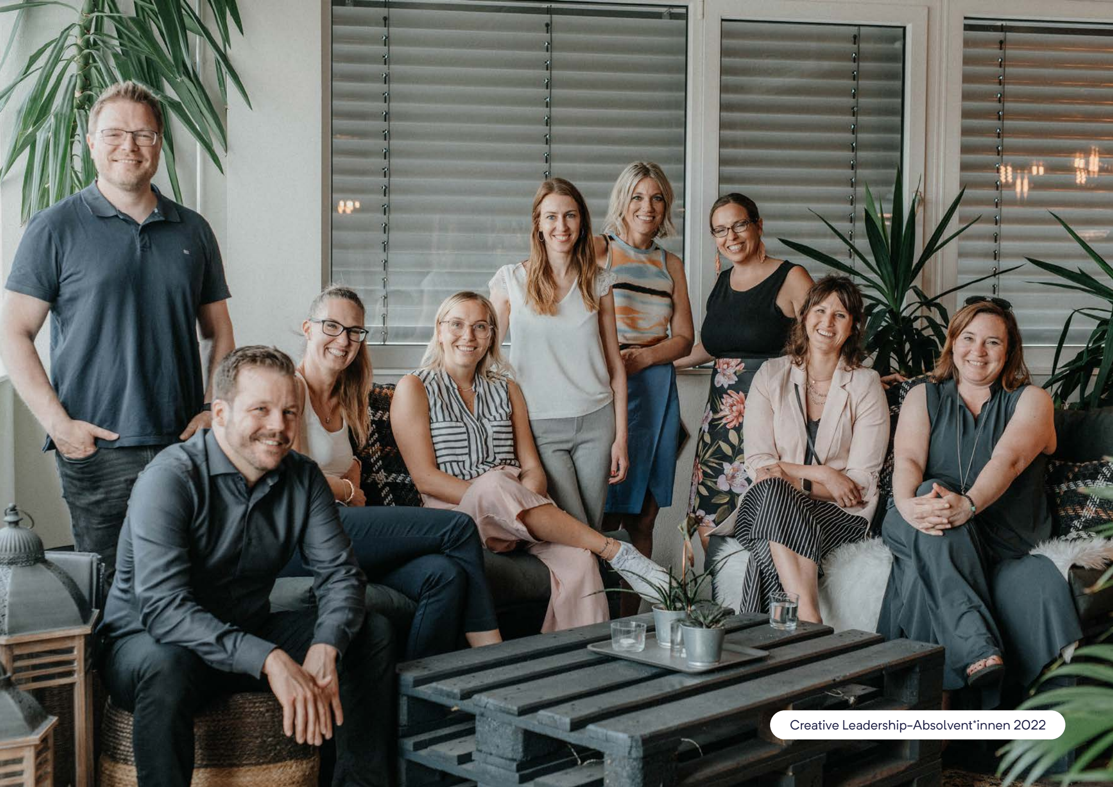
Creative Leadership-Absolvent*innen 2022