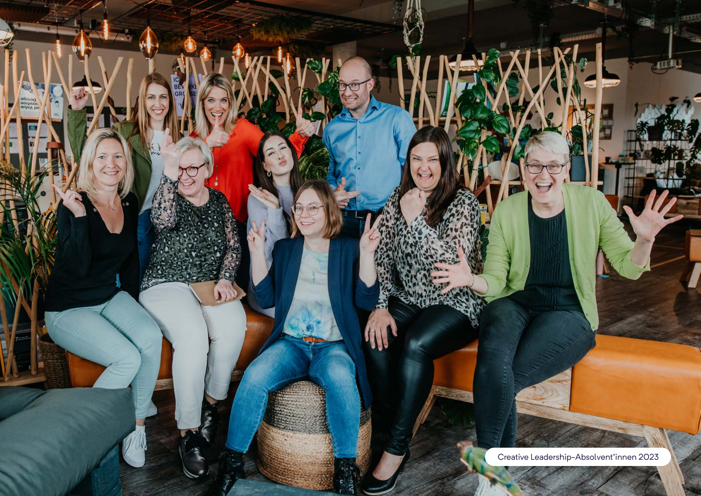
Creative Leadership-Absolvent*innen 2023